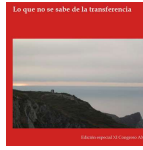
El Psicoanálisis nº13