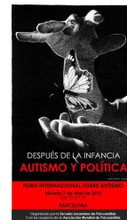
Foro Internacional sobre Autismo: Después de la infancia, Autismo y Política

Apertura del Foro Internacional Autismo “Después de la infancia. Autismo y política”