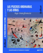
Scilicet. Las psicosis ordinarias y las otras bajo transferencia