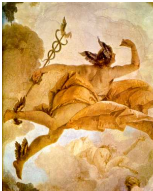
Bilbao 7 de marzo de 2017

“Para la ejecución del trabajo, adoptaremos el principio de una elaboración sostenida en un pequeño grupo. Cada uno de ellos (tenemos un nombre para designar a esos grupos) se compondrá de tres personas como mínimo, de cinco como máximo, cuatro es la justa medida. Más una encargada de la selección, de la discusión y del destino que se reservará al trabajo de cada uno. Luego de un cierto tiempo de funcionamiento, a los elementos de un grupo se les propondrá permutar en otro.” Jacques Lacan, Acto de Fundación.